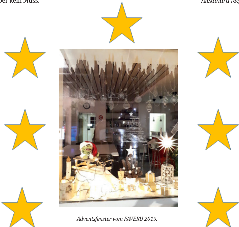
Adventsfenster vom FAVERU 2019.