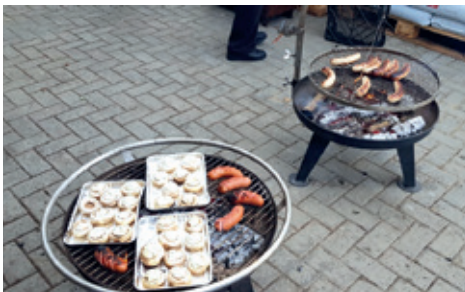
Grilladen für einen gemütlichen Abend.

Oder im Mai das zur Tradition gewordene Bräteln , das dieses Jahr wieder in Rupperswil stattgefunden hätte.