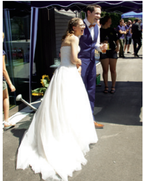
Flashmob an der Hochzeit.

Kurze Zeit später beim Apéro erwartete die beiden eine weitere Überraschung. Ein Grossteil der Hochzeitsgäste hatte im Vornherein einen Flashmob einstudiert, der nun um das Brautpaar herum aufgeführt wurde.