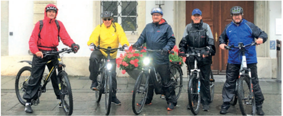
Eine wetterfeste Truppe.

Am Montag, 13. Juli, war der Start zum Sommerprogramm mit traditionellen Velotouren und anschliessendem gemütlichem Zusammensein beim Grillieren in der Waldhütte, Durstlöschchen im Restaurant und natürlich beim Speckessen beim STV.