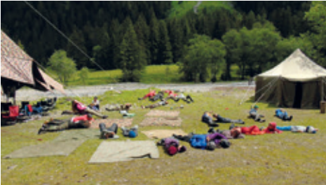
Eine kleine Siesta gefällig?

Das Kochen musste auch gelernt werden. Also machten wir mit der Hexe ein Game, wobei die Kinder selbständig kochen durften. Schlussendlich entschied sich die Hexe nur für die Gruppe, die besser gekocht hatte. Man merkte wie die Kinder langsam müder und müder wurden. Auch die anderen Dorfbewohner hatten mit der nachlassenden Kraft zu kämpfen. Darum gab es hin und wieder mal eine kleine Siesta, auch wenn eine davon nicht geplant war.