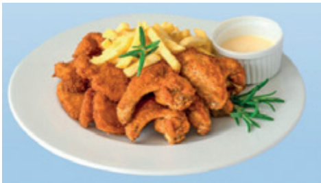
Der gluschtige FC Rapperswil-Teller.

Als spezielle Geste fliessen bei jedem bestellten Menu 2 Franken direkt in unsere Juniorenkasse. Unsere Juniorenabteilung bedankt sich herzlich für jede Bestellung vom FC Rapperswil-Teller und wir wünschen «En Guete».