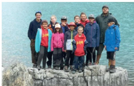
Der See war doch ziemlich kalt.

Dies machten die grossen und kleinen Teilnehmer getrennt, da die Suche nach Kohle länger andauerte. Die Kleinen fanden ihr Erz in der Nähe eines Sees, wo sie dann auch eine Pause machten, um ihren Lunch zu essen.