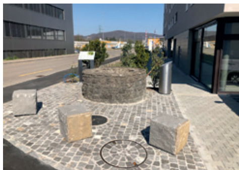
Sod Breechli (Areal Pafumi).

Unsere Generalversammlung, verbunden mit einer schlichten Einweihungsfeier für den renovierten Sod im Breechli auf dem Areal der Firma Pafumi , musste abgesagt werden.