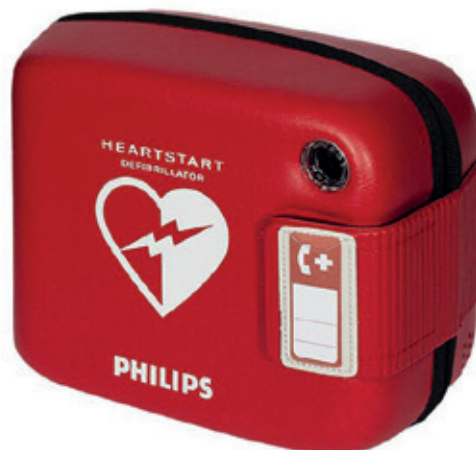
Der automatische externe Defibrillator (AED).