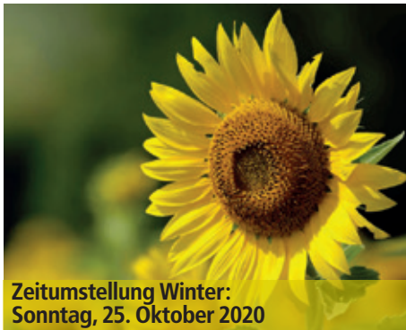
Zeitumstellung Winter: Sonntag, 25. Oktober 2020