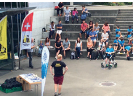
Impressionen vom Schach- und Sportcamp.