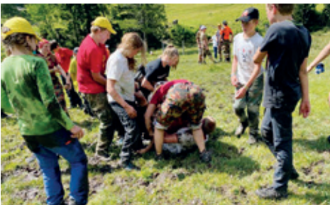
Ein fairer Kampf.

Wir waren danach alle so dreckig, dass wir unbedingt eine Dusche benötigten. Der Iffigenbach war leider nicht so warm wie die hauseigene Dusche, jedoch war er genau so wirksam. Alle frisch geduscht und gekleidet, fanden wir uns zum bunten Abend ein.