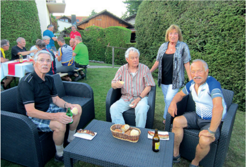
Der gemütliche Teil durfte auch nicht fehlen.