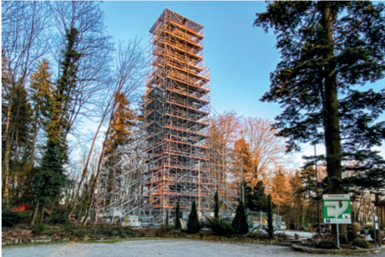
Spektakuläre Sanierung des Meiegrüen-Aussichtsturm hat begonnen.