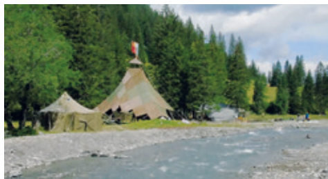
Das wunderschön gelegene Dorf.

Wir sind sehr froh, konnten und durften wir uns für das Sommerlager versammeln, um gemeinsam auf die Iffigenalp zu fahren. Denn dort wollten wir dem Häuptling und dem Baumeister helfen, unser eigenes Dorf aufzubauen. Das Endresultat liess sich anschauen, jedoch musste noch einiges geschehen, damit man in diesem Dorf leben konnte.