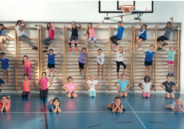
Mädchenriege klein, endlich wieder Training.