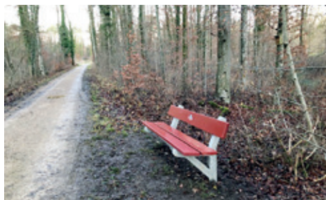
Neues Bänkli oberhalb Kanal.

Am Weg entlang dem Kanal (Weg zum ehemaligen Fussballplatz) wurden zwei alte Betonbänke ersetzt durch neue VVR-Bänkli.