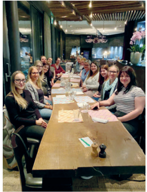
Die Damen haben das feine Essen geniessen.