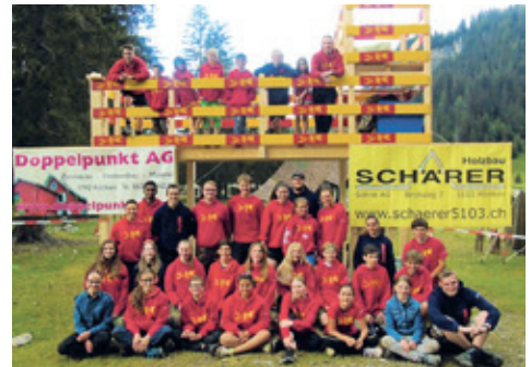
Die ganze Lagertruppe.

Abgeschlossen wurde der Abend mit einem romantischen Fackeltanz mit anschließender Dorfparty. Am nächsten Tag mussten alle dem Häuptling und dem Baumeister helfen, ihr Dorf wieder abzubauen. Dies klappte sehr gut und wir konnten dann pünktlich zu unserem Car laufen und nach Hause fahren.