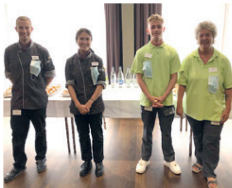
Die Lernenden mit ihren Ausbildnern.

Ein grosses Dankeschön gilt unseren Berufsbildenden, welche den jungen, heranwachsenden Berufsleuten in verschiedenen Lebenssituationen mit Rat und Tat zur Seite stehen.