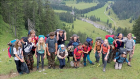
Die Grossen, im Hintergrund unser Lagerplatz.

Das Kochen musste auch gelernt werden. Also machten wir mit der Hexe ein Game, wobei die Kinder selbständig kochen durften. Schlussendlich entschied sich die Hexe nur für die Gruppe, die besser gekocht hatte. Man merkte wie die Kinder langsam müder und müder wurden. Auch die anderen Dorfbewohner hatten mit der nachlassenden Kraft zu kämpfen. Darum gab es hin und wieder mal eine kleine Siesta, auch wenn eine davon nicht geplant war.