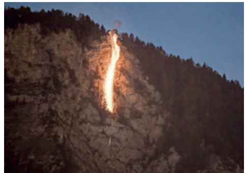
Spektakel an der Mariawand in Oberurnen.