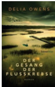
Der Gesang der Flusskrebse von Delia Owens