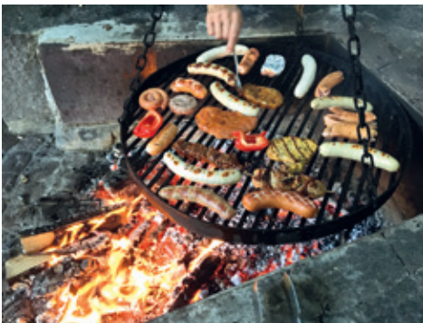
Das feine Essen war allseits beliebt.