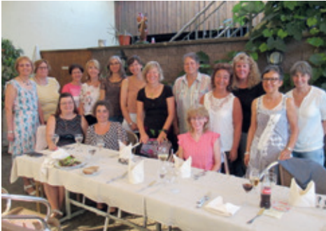
Es hat sich eine grosse Schar im Restaurant Hallwyl eingefunden.