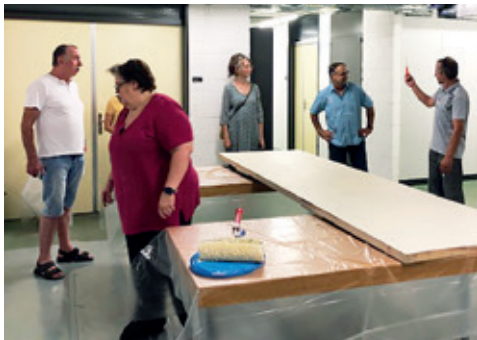
Kulissen werden auf Vordermann gebracht!

wie im Flug und nach getaner Arbeit durfte natürlich das durstlöschende Getränk im Restaurant Freihof nicht fehlen. Wir haben es verdient und genossen den Feierabend.