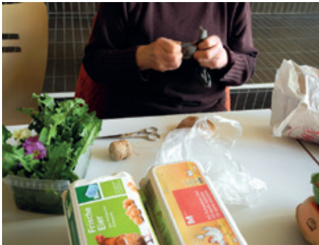
«Werkzeuge» fürs Eierfärben.

Da wäre zum Beispiel Anfang April das Färben der Eier für den Ostergottesdienst.