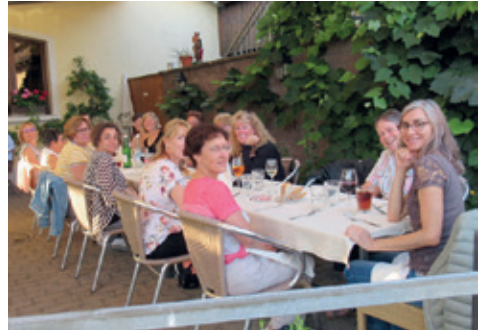
Die Turnerinnen freuen sich auf die feinen Fische.