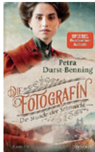
Die Fotografin – Die Stunde der Sehnsucht von Petra Dürst-Benning