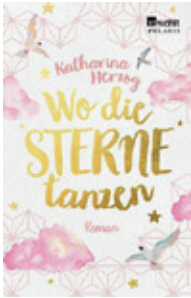
Wo die Sterne tanzen von Katharina Herzog

Wir haben fleissig recherchiert, um keine zukünftigen Bestseller zu verpassen. Hier eine kleine Auswahl, welche schon eingetroffen ist oder im Laufe des Herbstes erscheinen wird: